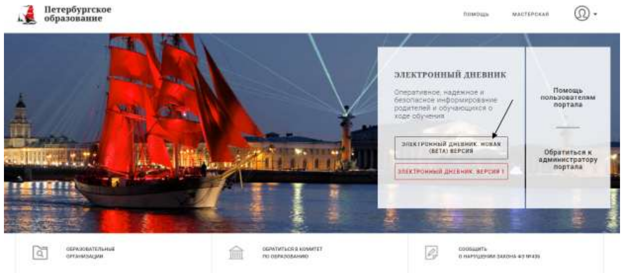
Рисунок 1 – Главная страница на «Портал Петербургское образование»

Прежде чем подать заявление на подключение к сервису, родитель должен пройти регистрацию на портале «Петербургское образование». После получения на эл. почту логина и пароля для входа на портал Пользователю необходимо авторизоваться и перейти к новой версии Электронного дневника, как показано на Рисунке 1.