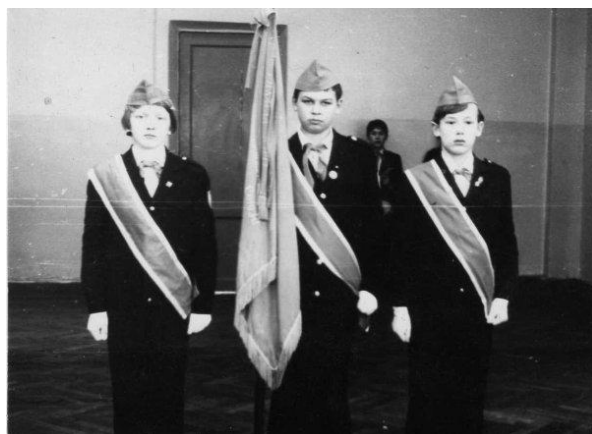
Знаменосцы школы № 17