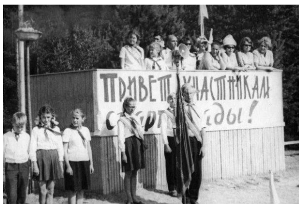
Линейка, посвященная открытию Спартакиады