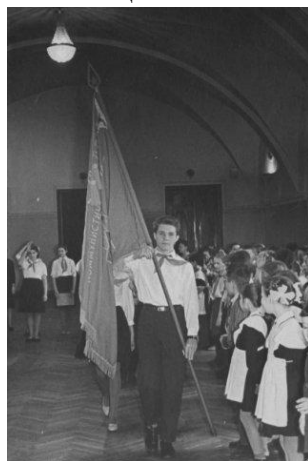
Вынос знамени на торжественной линейке в Академии тыла и транспорта