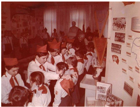
Прием в пионеры октябрят 3 «а» класса. Фото 1984 г.