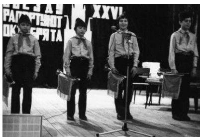
Районный праздник для октябрят открывают горнисты нашей школы. Фото 1986 г.