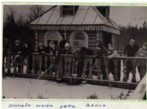
Отсюда течет река Волга

В 1963-64 г.г. был организован поход на лыжах по Волговерховью, к озеру Селигер, по местам боев партизан на Псковщине.