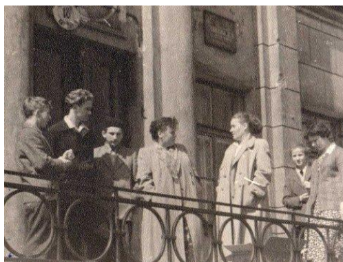
Встреча туристической группы перед походом.