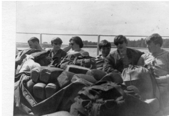
Поход на лодках по Вуоксе

В течение 10 лет команда нашей школы участвовала в городских турслетах и занимала призовые места.