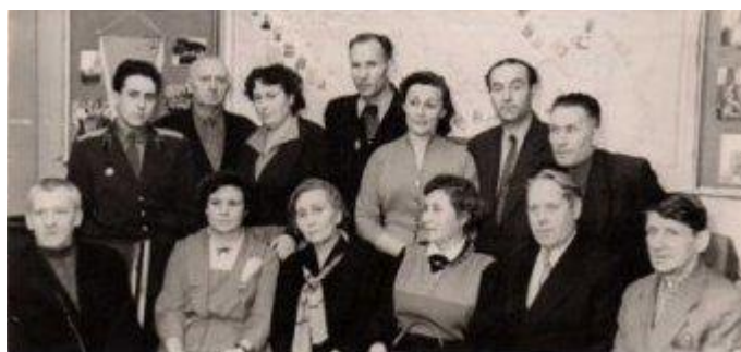
Ополченцы Балтийского завода.

В 1959 г. произошло знакомство с участниками ополчения Балтийского завода