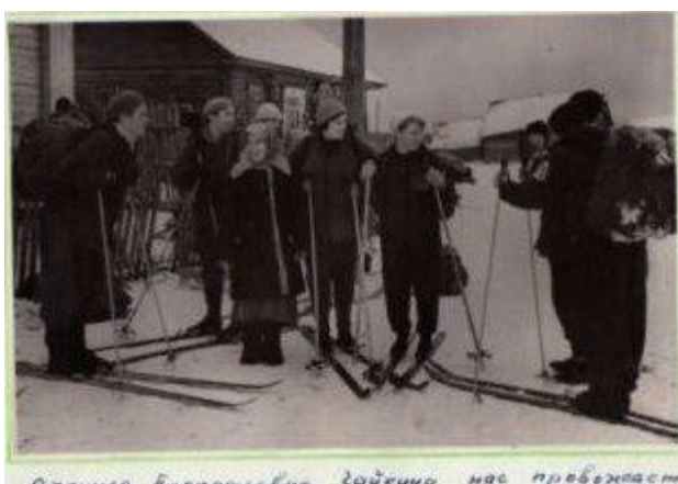
Встреча с матерью партизанки Лизы Чайкиной, казненной в 1942 г. фашистами

Летом 1965 г. был организован автобусно-пешеходный поход от Феодосии до Севастополя. В Крыму проводили научную работу по изучению подводного мира Черного моря на биостанции «Крымская».