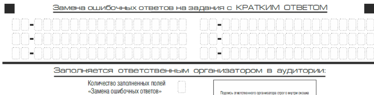
Рис. 9. Область замены ошибочных ответов на задания с кратким ответом

Запрещается записывать ответ в виде математического выражения или формулы. В ответе не указываются названия единиц измерения (градусы, проценты, метры, тонны и т.д.) – так как они не будут учитываться при оценивании. Недопустимы заголовки или комментарии к ответу.